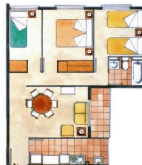
PLANTA TIPO 2